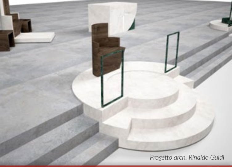
Progetto arch. Rinaldo Guidi