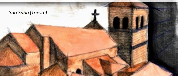
San Saba (Trieste)